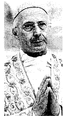
Angelo Bagnasco, arcivescovo di Genova e presidente della Conferenza episcopale italiana, oppone un "no" alla creazione dei registri di fine vita

La maggior parte sono state sottoscritte da uomini (5) e donne (14) tra i 51 e i 60 anni